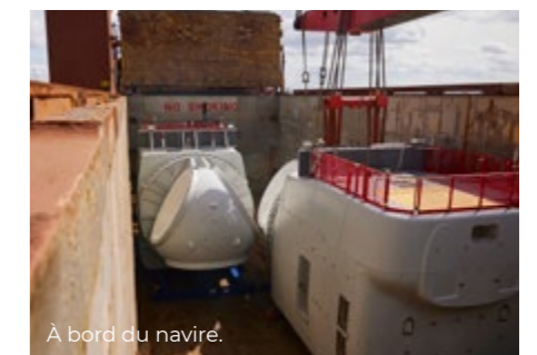
À bord du navire.

charges. Les bateaux transportent généralement six nacelles lors de chaque rotation." Les manœuvres nécessitent une coordination et une attention de tous les instants, impliquant de 12 à 15 personnes lors de chaque opération. Environ 400 Haliade X devraient ainsi transiter par le TMDC 5 dans les mois à venir.