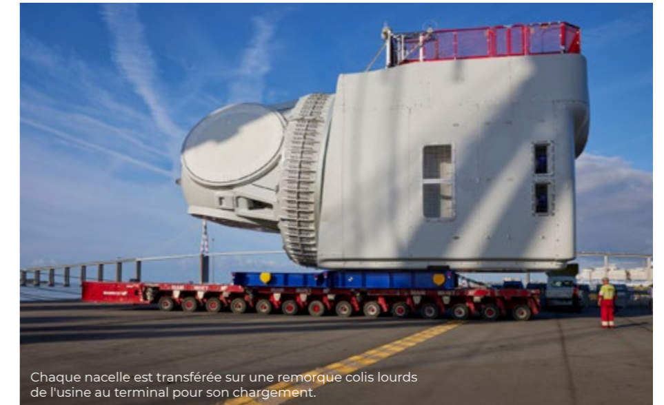
Chaque nacelle est transférée sur une remorque colis lourds de l'usine au terminal pour son chargement.