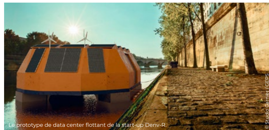
Le prototype de data center flottant de la start-up Denv-R.