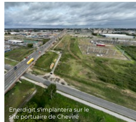
Enerdigit s'implantera sur le site portuaire de Cheviré

De son côté, l'entreprise Enerdigit, spécialisée dans l'effacement, a lancé les travaux pour sa future installation sur la zone de Cheviré, à proximité du poste de transformation de RTE. Ce système permet de stocker de l'électricité grâce à des batteries pour limiter les effets de pics et de creux, puis de la redistribuer auprès des consommateurs industriels.